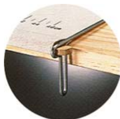
キャンバスをしっかりと固定します。